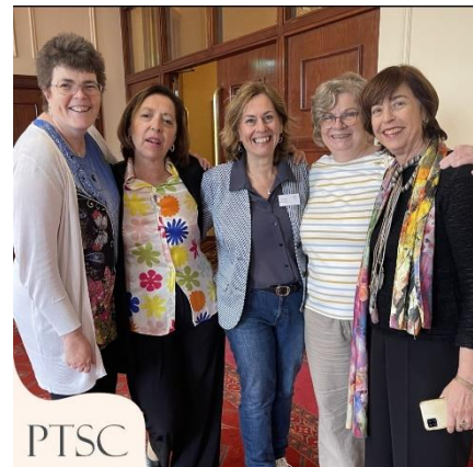
Professional Training Standard Committee